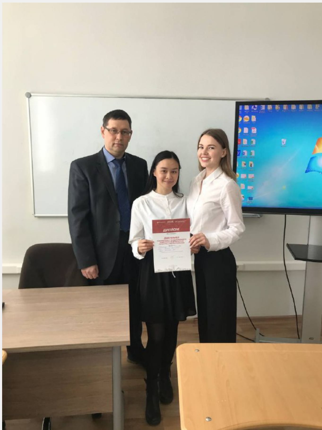
По итогу секционных выступлений девушки заняли третье место!