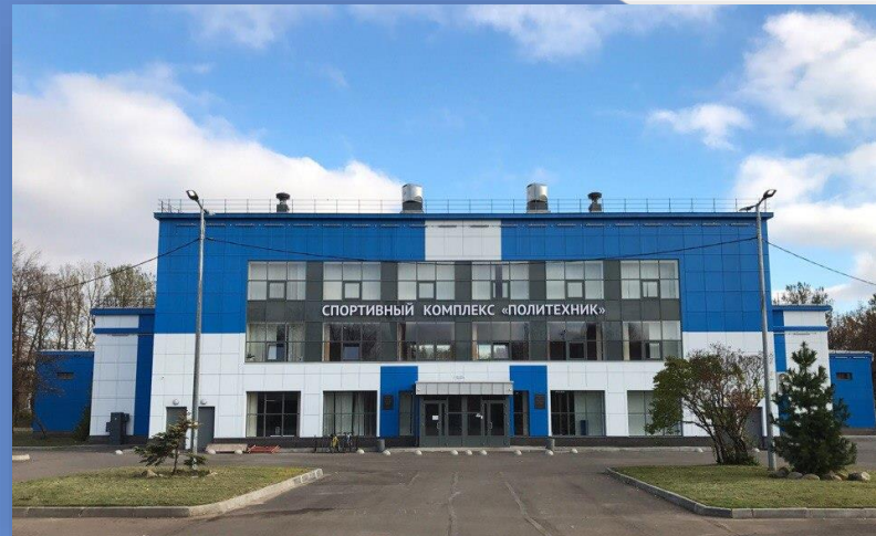
Ул. Политехническая 27 СК «Политехник»