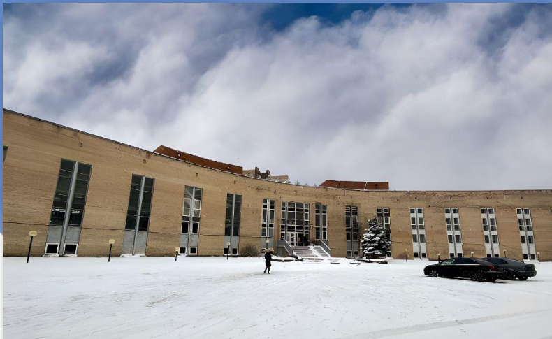
Пр. Энгельса 23 Б Бассейн